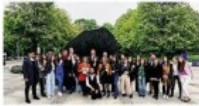
50 under 30 bergamaschi del Consiglio dei giovani a Ludwigsburg

Il viaggio Tornano oggi i componenti del Consiglio dei Giovani. A Bergamo i colleghi tedeschi dal 26 al 29 maggio